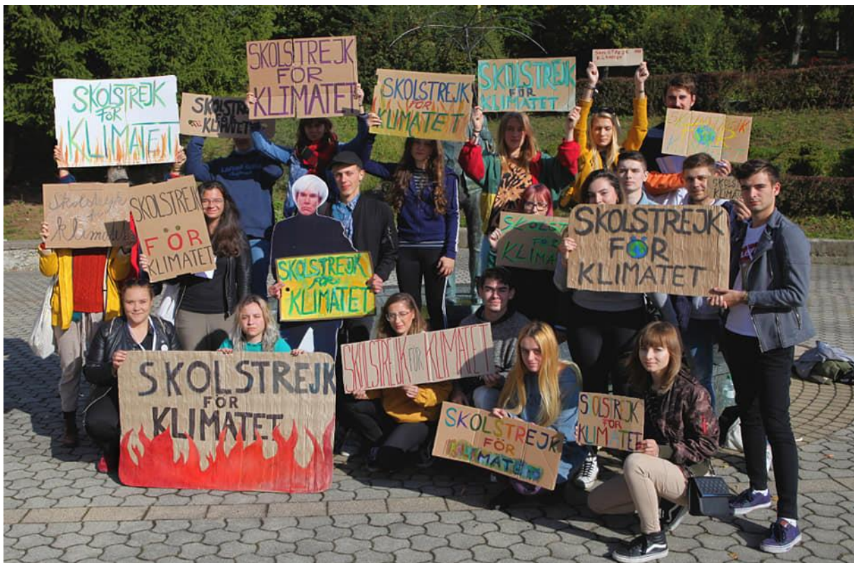
Workshop MMURW v Medzilaborciach, 17. - 21. septembra. 2019 (protestný happening, ktorým sa študenti zapojili do prebiehajúceho celosvetového klimatického štrajku)