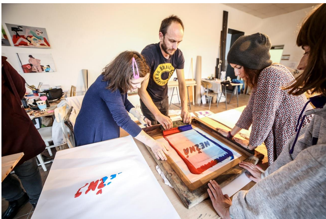
Workshop sieťotlače, Katedra grafiky FVU