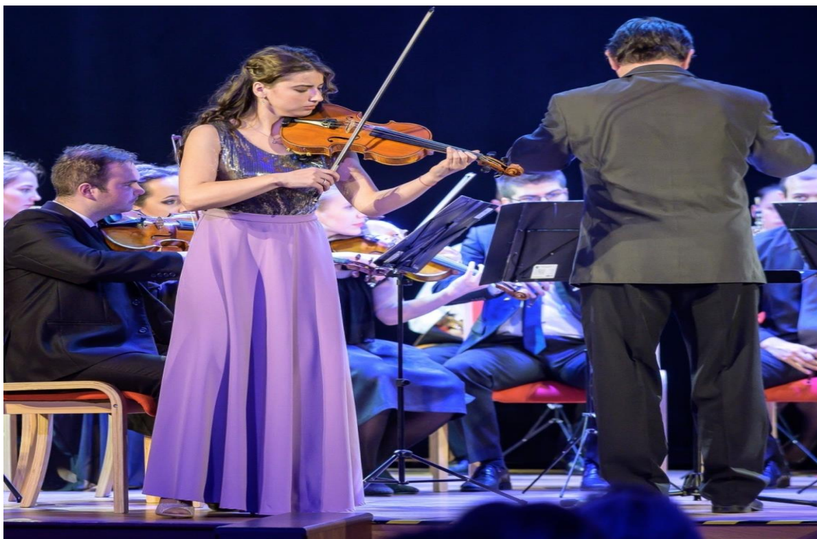
Koncert orchestra Camerata Novisoliensis, Banskobystrická hudobná jar, 15. apríla 2019