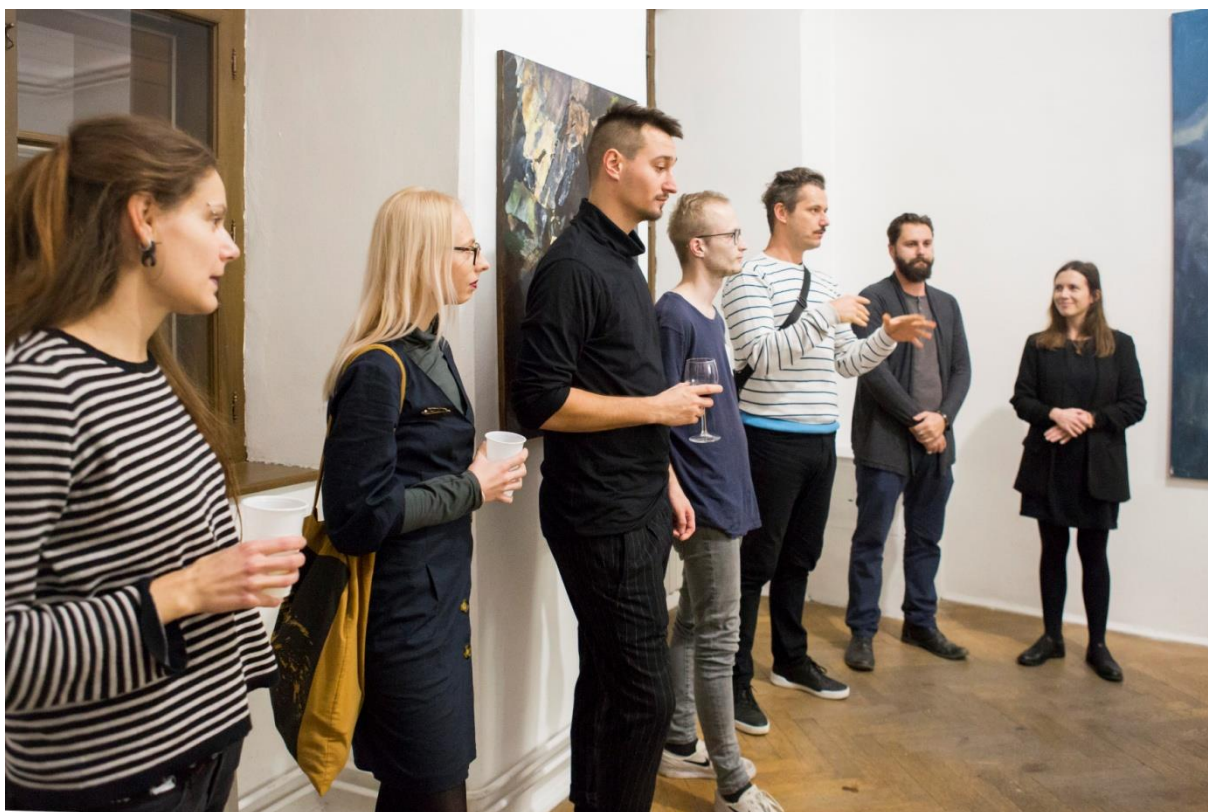
Vernisáž výstavy Mladá pamäť