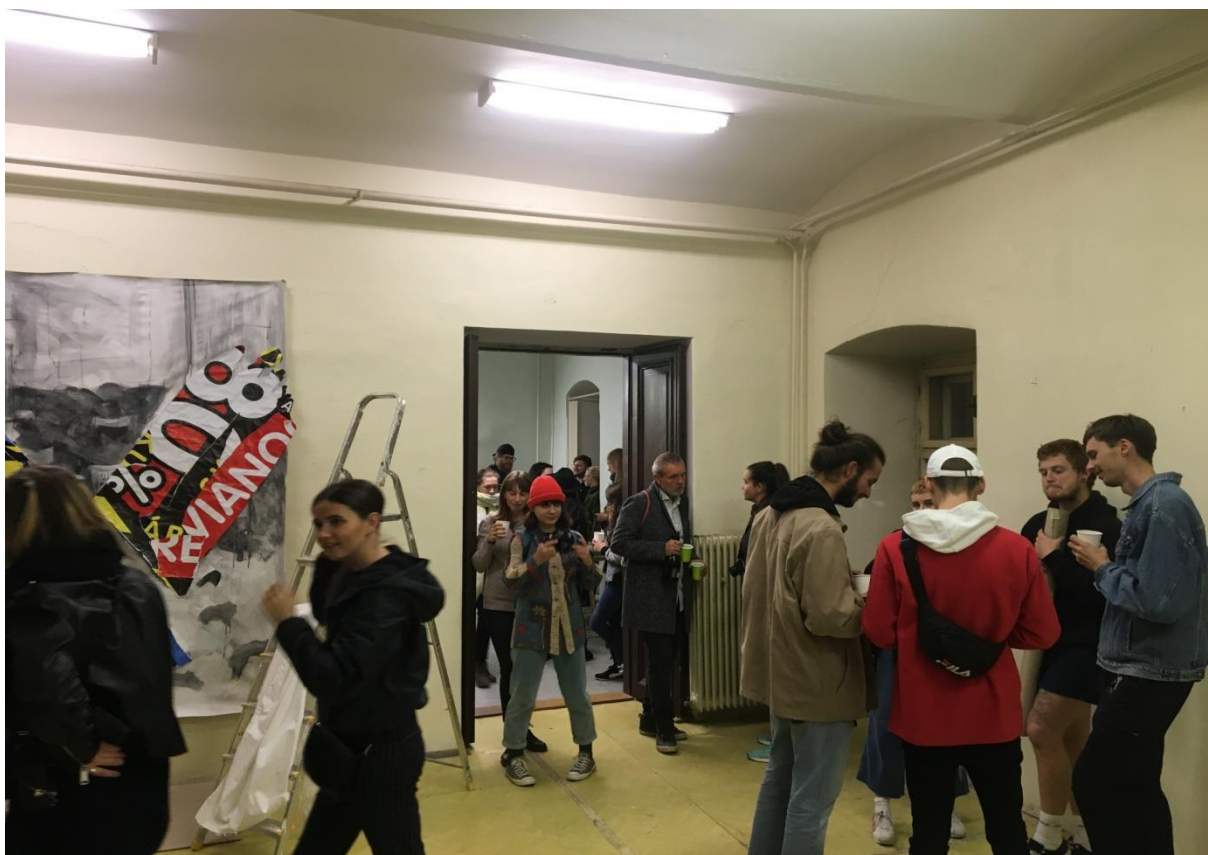
Workshop a výstava Pod zemou 2., Katedra malby FVU