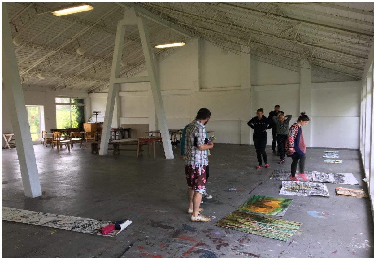
Workshop v Tihany I, Katedra maľby FVU