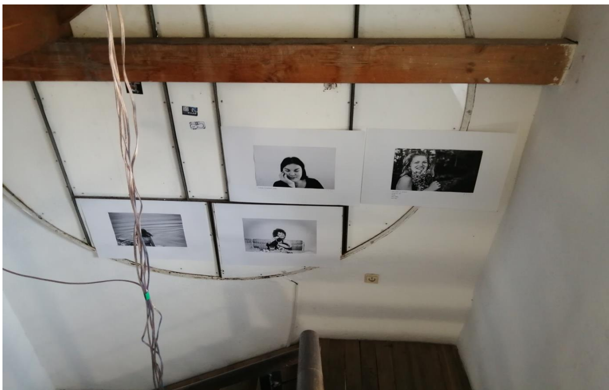
Výstava fotografií v Mestskej hodinovej veži v Banskej Bystrici k 30. výročiu Nežnej revolúcie. Sériu portrétov, ktoré odkazujú na revolučný rok 1989 až po súčasnosť. Čo znamená sloboda pre ľudí narodených po revolúcii. 17. november – 17. december 2019