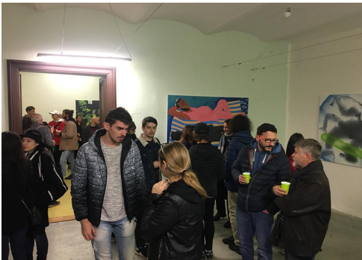
Workshop a výstava Pod zemou 1., Katedra malby FVU