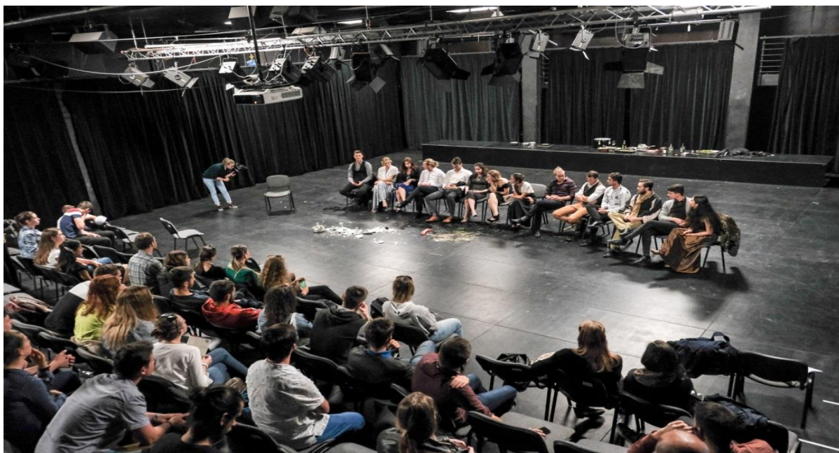
Artorium, diskusia po predstavení, október 2019