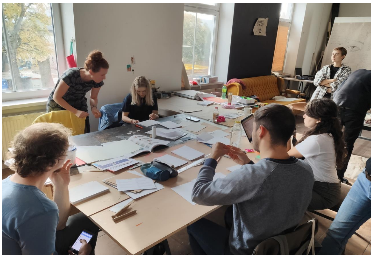
Workshop knižnej väzby, Katedra grafiky FVU