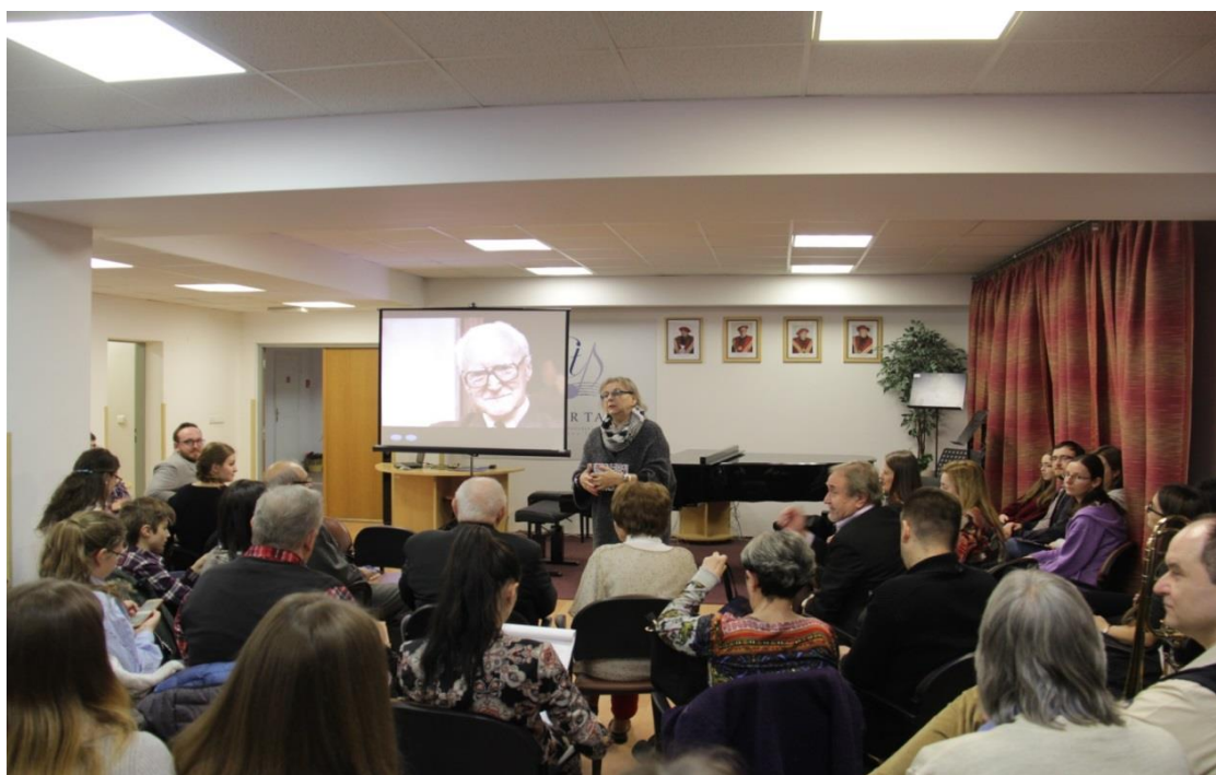
Reflexie – Stretnutie s Eugenom Suchoňom, 18. februára 2019