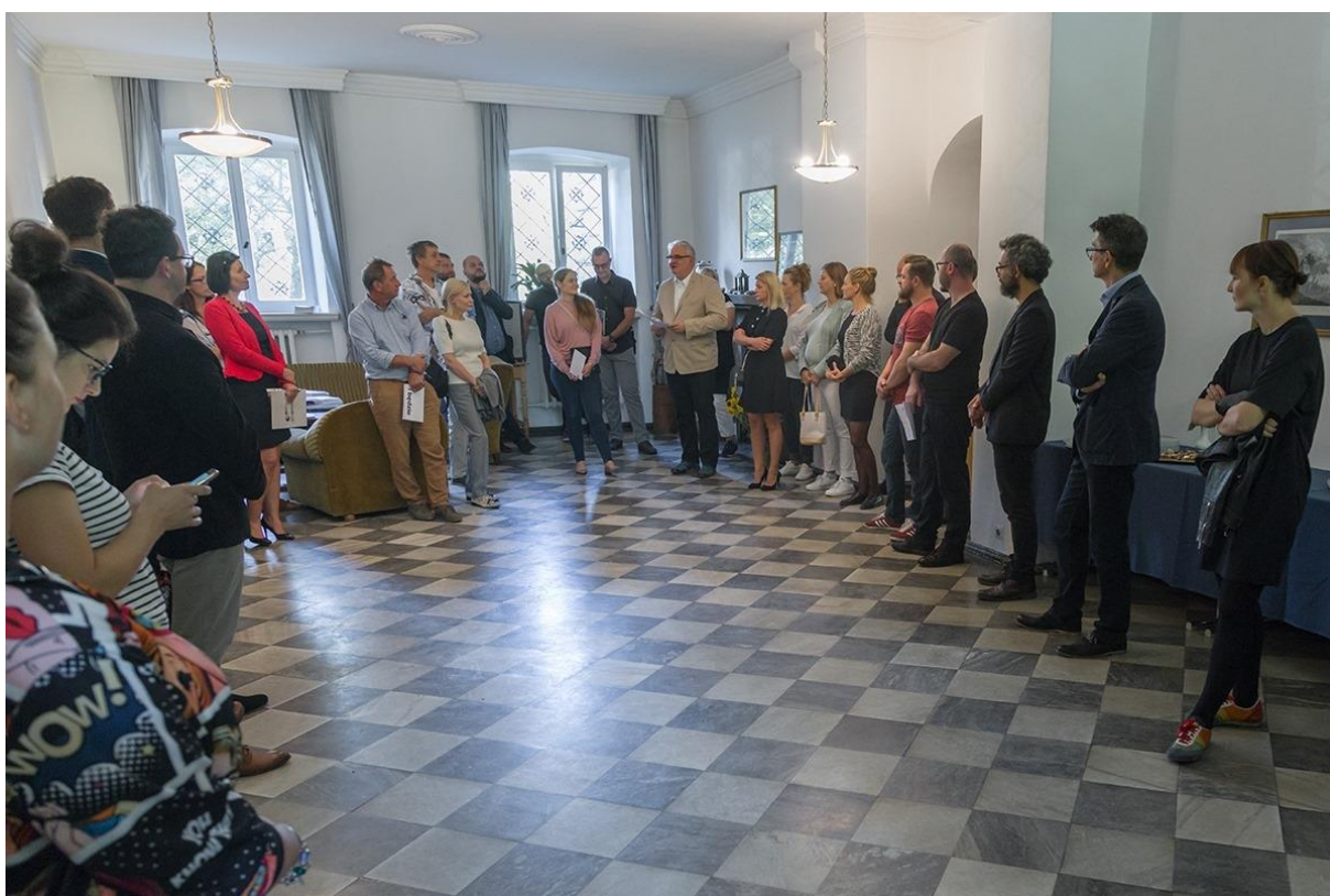
Medzinárodné sympóziu Morawa Poľsko, Katedra sochárstva FVU