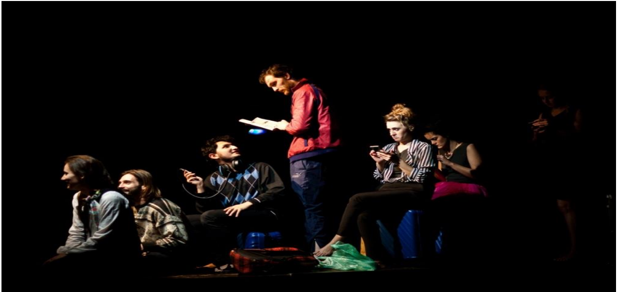
Divadelné predstavenie ANI MAK, Noc divadiel 2019