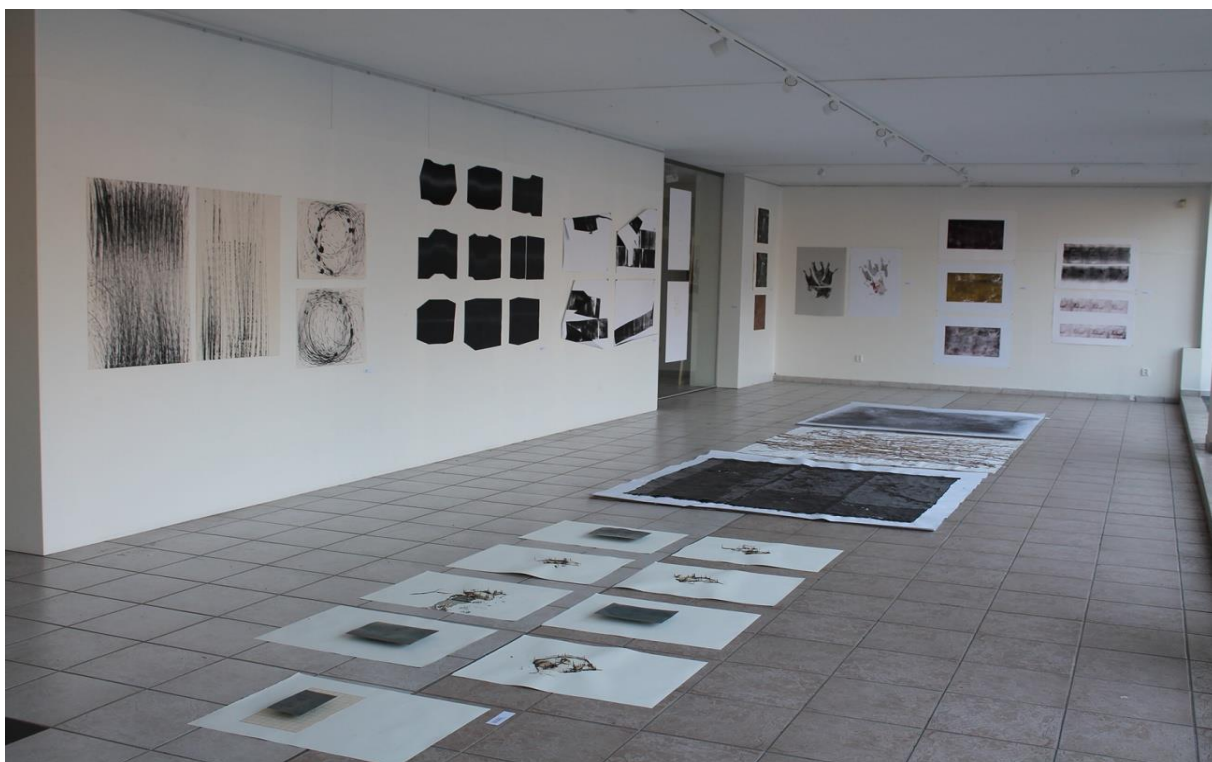
Výstava Akčné polohy grafiky v Galérii Fx, Katedra grafiky FVU