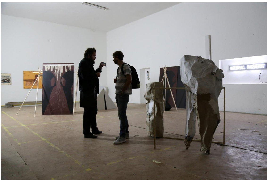
Park camp, Katedra grafiky FVU