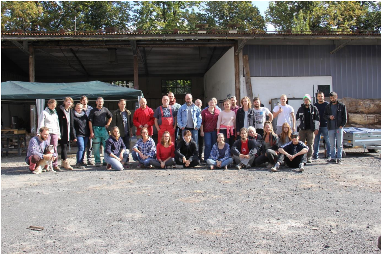
Medzinárodný workshop odlievania liatiny, Katedra sochárstva FVU