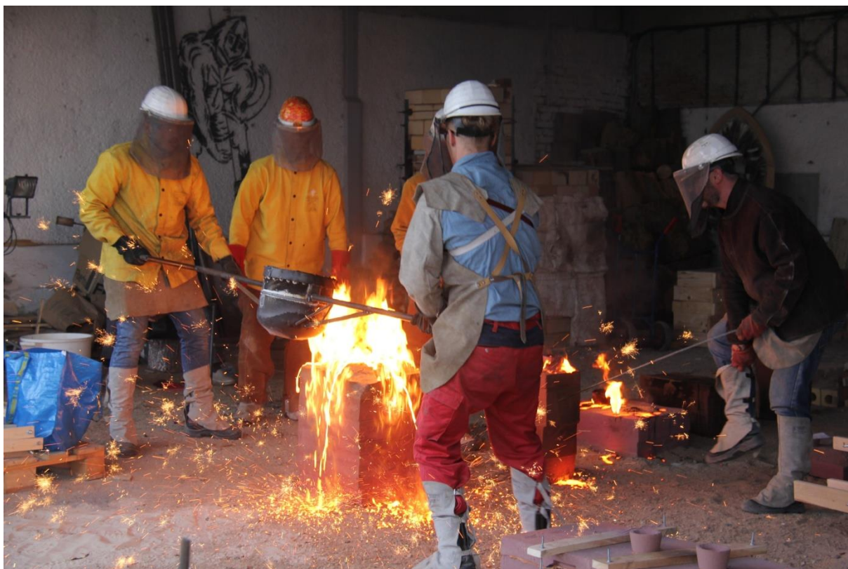
Medzinárodný workshop odlievania liatiny, Katedra sochárstva FVU