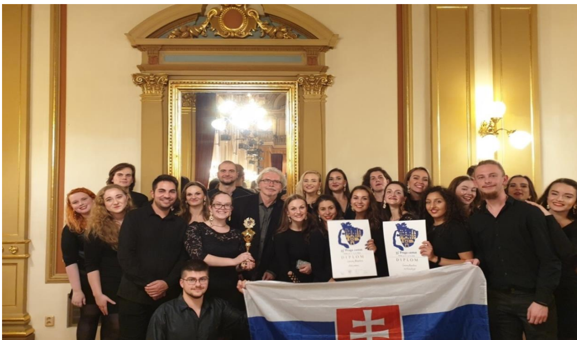
Zbor Canzona Neosolium, Praga cantat 2019