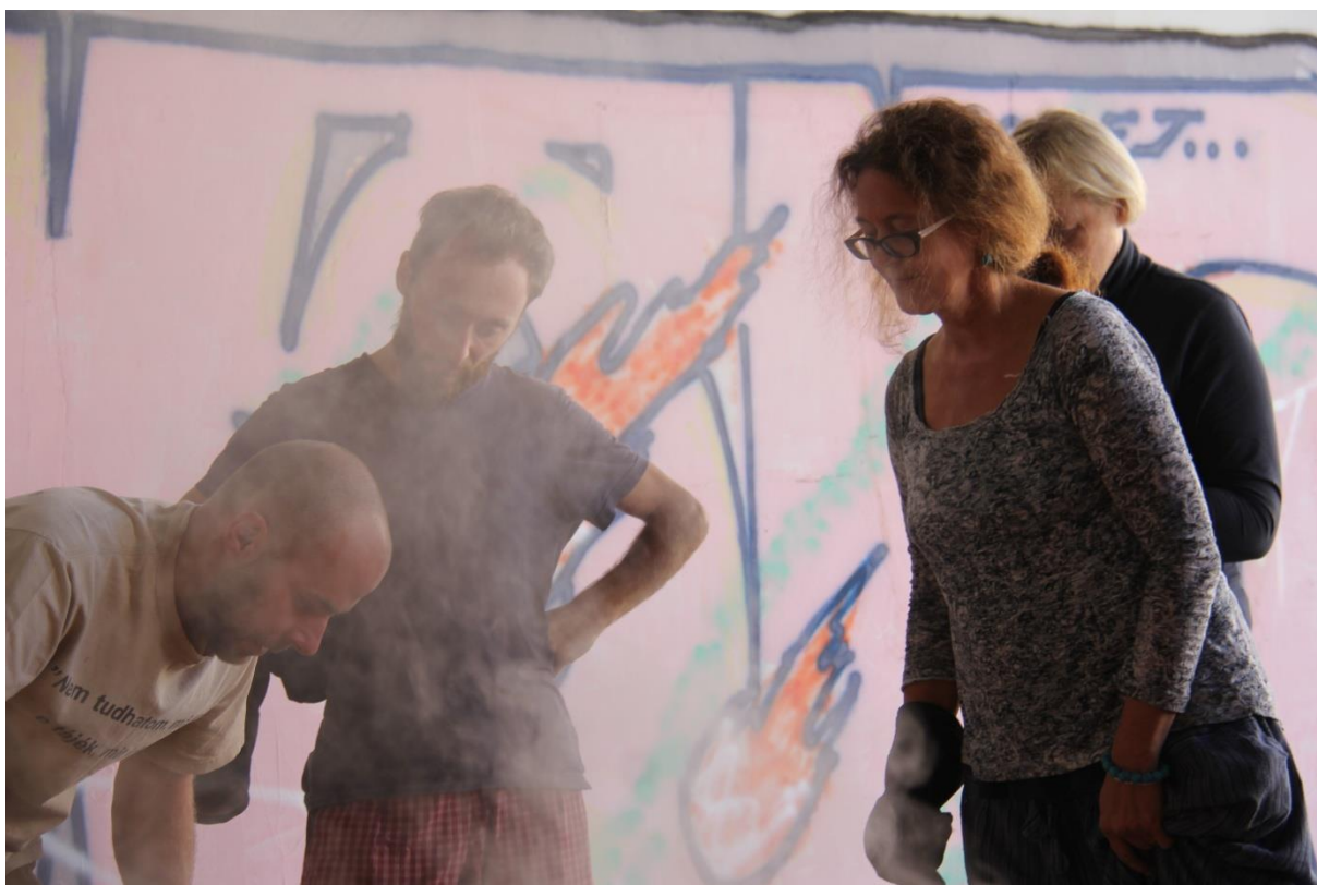
Workshop experimentálnej keramiky, Katedra sochárstva FVU