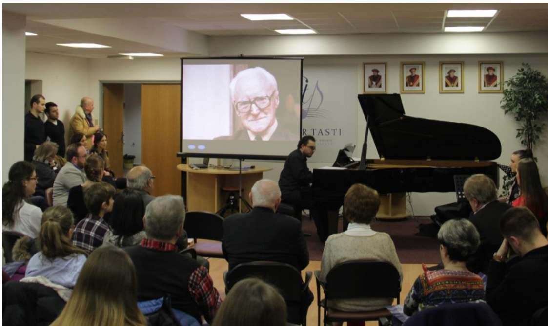
Reflexie - Stretnutie s Eugenom Suchoňom, 18. februára 2019