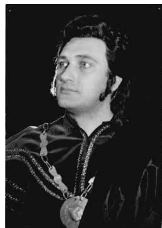
Ako Don Ottavio v Donovi Juanovi - premiéra v roku 1971.