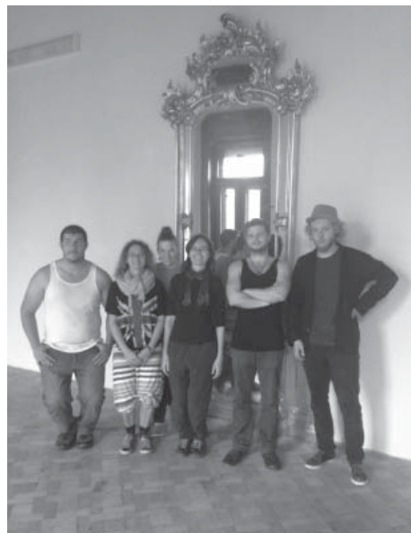
Inštalčný tím v plnej paráde

„Tu a teraz“ Katedry sochárstva Fakulty výtvarných umení Akadémie umení v Banskej Bystrici predstavila výstava, usporiadaná v októbri – novembri t. r. v Pisztoryho paláci v Bratislave pod patronátom MVO Via cultura, mestskej časti Staré mesto a s finančnou podporou Ministerstva kultúry SR. Okrem aktuálnych diel pedagógov a študentov dala do pozornosti aj finálne, diplomové práce nedávnej histórie katedry.