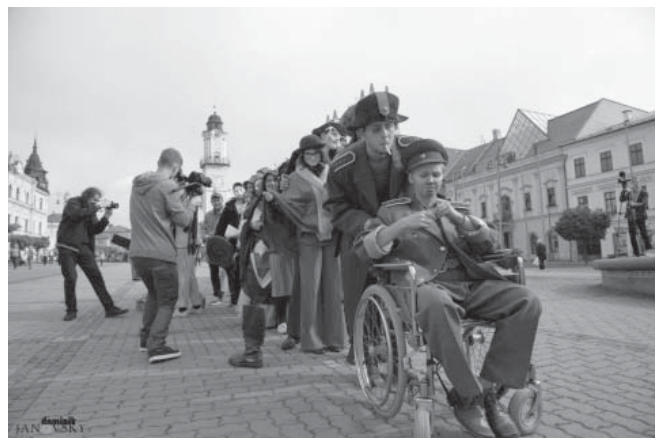
Artorium zavítalo aj na Námestie SNP

Pre verejnosť – a tento ročník ukázal, že nielen pre verejnosť – sa v prvý deň festivalu organizuje sprievod divadelných súborov po historickom centre Banskej Bystrice. Zväčša sú účastníkmi tohto podujatia naši študenti odetí v najnovšej kolekcii značky Fundus od pani Spiššakovej, avšak tohtoročného sprievodu sa zúčastnil i herecký súbor zo Srbska, ktorý sa neváhal naučiť náročný text festivalovej hymny „Ra pa papa pa ra pá...“ a vyrazil do ulíc spolu s našimi študentmi. Sprievod mali v rukách (v ktorých mali aj mikrofó-