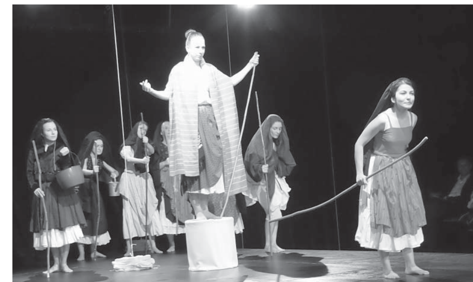
Fragment z inscenácie

Dôležitou postavou sú zbor starcov a zbor starien a tieto dva zbory ostávajú na scéne ako udržiavatelia nepriateľskej línie nepretržite od začiatku až do konca. Sú prítomní ako zástupcovia dvoch rodov – ženského a mužského, dvoch spôsobov myslenia, dvoch opozitných živlov, ktoré sa navzájom negujú – voda a oheň. Charakter konfliktu medzi týmito zbormi je