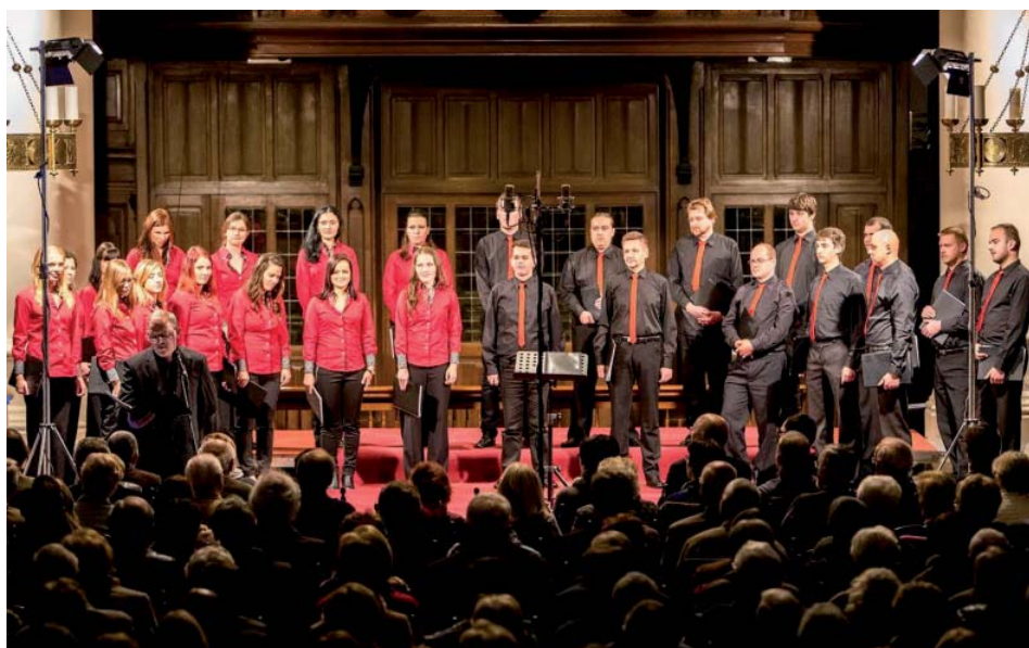
Canzona Neosolium, koncert vo Waregеме

Posledná skúška po niekoľkodňových sústreďeniach, posledné doladovanie detailov, posledné rady dirigenta ohľadne zachovania hlasového pokoja až do koncertu. Ťažko niečo podobné dodržať, keď nadšenie a radosť zo zážitkov budúcich dní núti spevákov do spevu. Dopoludnie na Akadémii umení sa nieslo v znamení pracovného pobytu akreditačnej komisie. Niet lepšieho dôkazu kvality umeleckej práce so študentmi na našej škole, ako predviesť svoje umenie priamo pred jej člen-