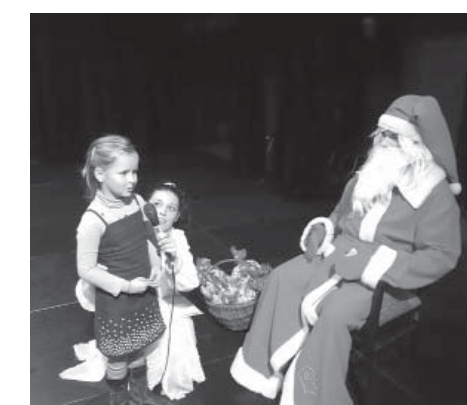
Ani na deti zamestnancov Akadémie umení Mikuláš nezabudol. A keďže detúrence boli poslušné, prejavil svoju obligátnu rozšafnosť a všetky pekne – krásne obdaroval...