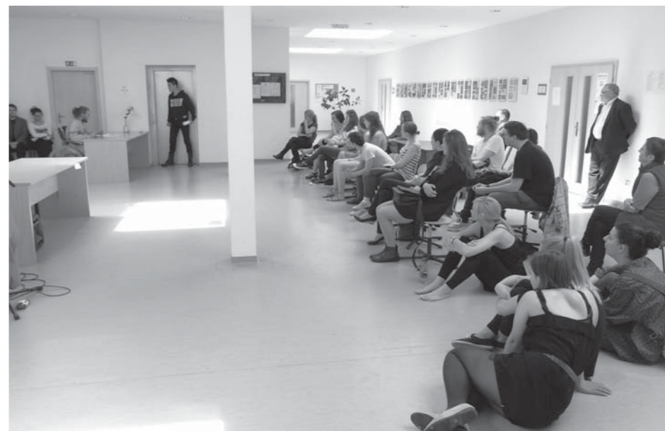
Pohľad do auditória

„Poľsko venovalo tento rok svojmu divadlu a keďže je tam kumulácia významných výročí, tak sme to spojili s týmto podujatím. Je to snaha zatiaľ tak trochu donkichotská, no dúfam, že perspektívna, aby sa v rámci Višegrada budovali organické vzťahy medzi našimi malými, ale významnými kultúrami. Nuž a keď sa do toho študenti obujú, ako sa patrí, tak to má budúcnosť.“