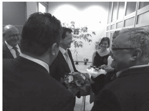
Z privítania ministra Juraja Draxlera