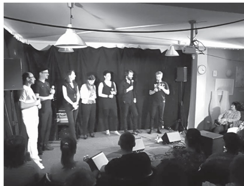
Z vystúpenia Fragile...