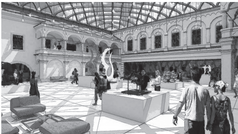
Vizualizácia preskleného nádvorja kaštieľa

Akadémia umení začiatkom tohto roka rozbehla aktivity v súvislosti s Občianskym združením (OZ) Kaštieľ Radvanských, ktoré vzniklo ešte koncom roka 2013. V tejto súvislosti 18. januára 2016 oslovila listom poslancov Mestského zastupiteľstva v Banskej Bystrici. Uvádza sa v ňom: