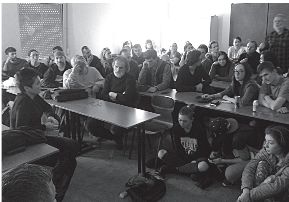
Zasadnutie akademickej obce FVU AU

Časť vysokoškolských učiteľov vo februári t. r. prerušila prácu a vstúpila do ostrého štrajku. Vysokoškolskí pedagógovia tak prebrali štafetu po Iniciatíve slovenských učiteľov (ISU), ktorá štrajk prerušila, no zostala v štrajkovej pohotovosti. Ako uviedla Iniciatíva vysokoškolských učiteľov (IVU), ktorá akciu organizovala, do štrajku vstúpili na protest voči spôsobu, akým sa s ich kolegami zaobchádza a na znak nesúhlasu s nedôstojným spoločenským postavením, ktoré táto krajina prisudzuje učiteľom, ale predovšetkým na podporu požiadaviek ISU.