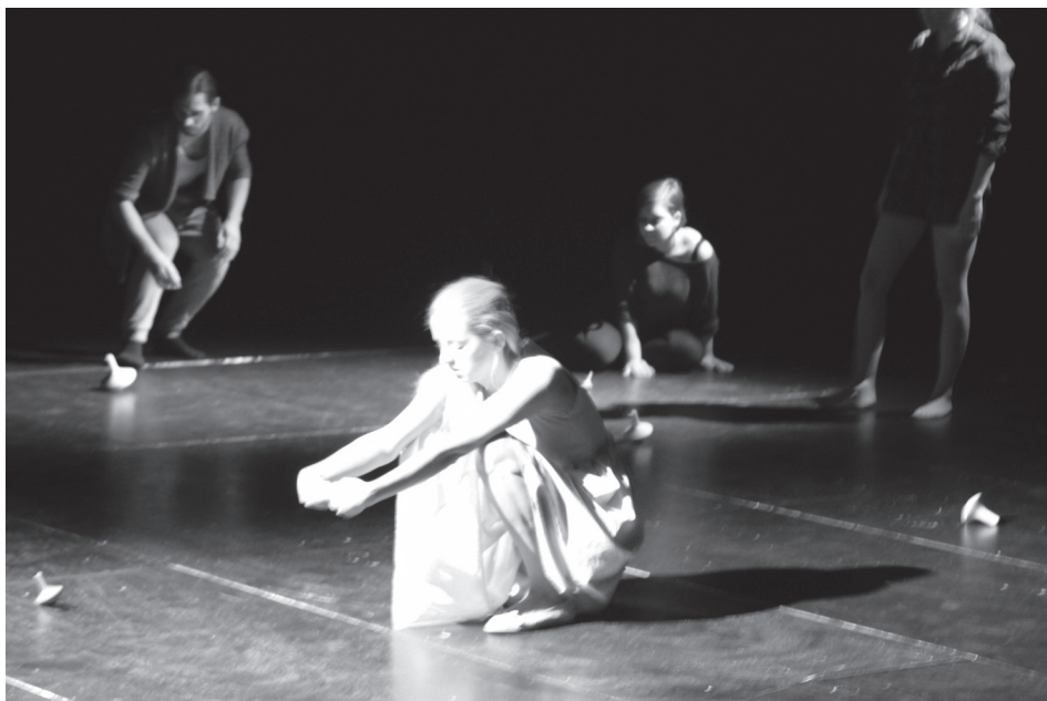
Momentka z predstavenia

- Zrejme je to aj moje osobné, vnútorné cítenie otázky sociálnej nespravodlivosti a hlavne ľudskej necitlivosti, hlúposti a zvlčivosti. Prosto, asi je to moja vnútorná potreba poukázať na to, že aspoň na chvíľu by sme nemali byť takí, akí sme. Mrazí ma čas, priestor a ľudia okolo, ktorí neprejavujú žiadnu empatiu voči druhému človeku a sú orientovaní