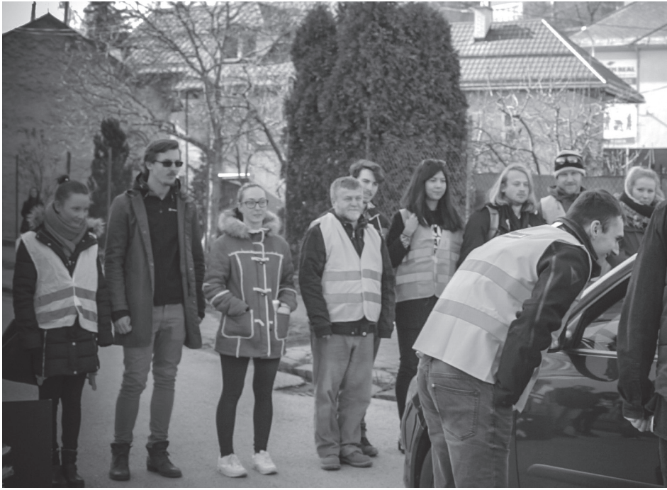
MÚR – dobrovoľná skupinová performance študentov a pedagógov Akadémie umení v Banskej Bystrici