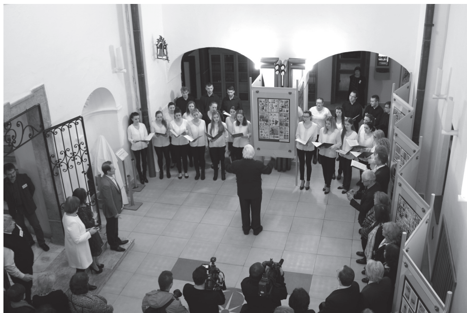
Zo slávnostného otvorenia akcie v útrobach Štátnej vedeckej knižnice.