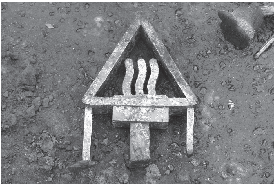
logo workshopu v 3D liatina tesne po odliatí

V roku 2014 som sa osobne na pozvanie zúčastnila desaťdňového medzinárodného workshopu odlievania na ASP Gdansk – fascinovaná dovtedy nepoznanou technológiou, ale pomerne jednoduchou výrobou zlievárenských foriem som videla nové možnosti pre výučbu na katedre sochárstva a priestorových foriem. Obnova umeleckého zlievárenstva v slo-