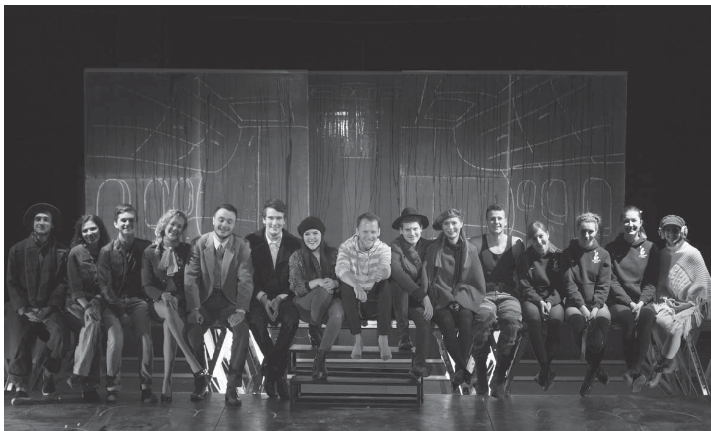
Aktéri hry aj s režisérom