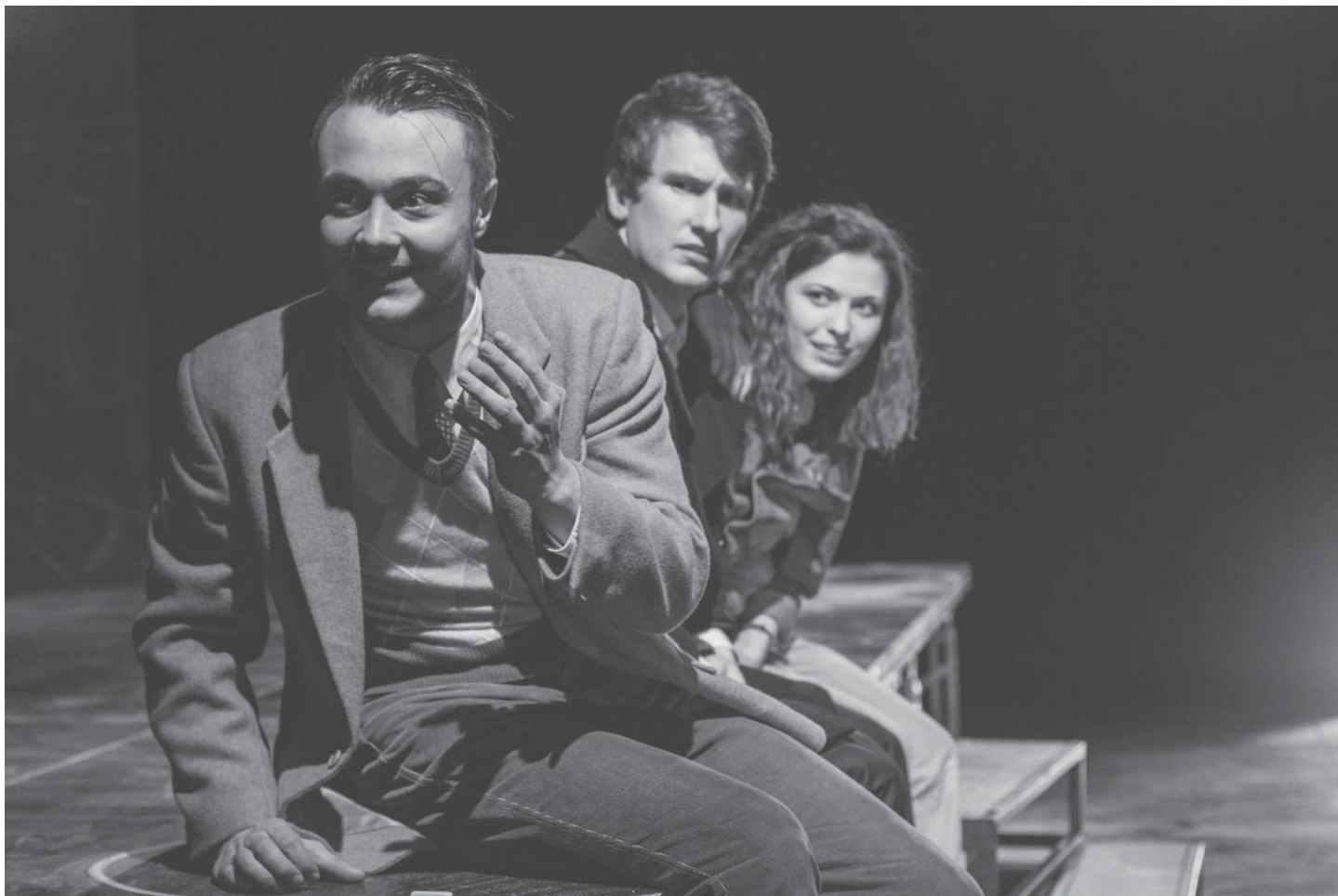
Fragment z hry Terorizmus

Po návrate na Slovensko som skúmal, či je tento text preložený. Nebol. Mal som už v rukách ruský originál a český preklad a s týmito dvoma zbraňami som sa v lete pustil do prekladu. Český preklad sa mi však veľmi nepáčil, a tak som originál intenzívne konzultoval s Rusmi. Po anglicky. Bol to teda veľmi zábavný preklad, pretože fungoval akoby na úrovni štyroch jazykov... A vlastne to, čo inscenujeme, je môj preklad. Je to moja prekladateľská prvotina, nikdy predtým som sa neodvážil do toho pustiť. Pomohol mi však český preklad a rusky hovoriaci ľudia, ktorí mi vysvetlili akoby čaro toho jazyka. Nakoniec sa to teda podarilo a čo ma veľmi bavilo, že som text priniesol študentom - ide kompletne o druhý ročník - aby som poznal, čo oni na to. Ich to ohromne oslovilo a následne inšpirovali oni mňa. Svojimi postrehmi, svojím postojom voči tomu, čo v tom videli. Zrazu som zistil, že áno, toto má pre nich potenciál, lebo hra oslovuje mladého človeka, je to súčasný text, veď autori v čase jeho zrodu mali 28, resp. 33 rokov. Zrazu som videl že študenti ten text cítia, vnímajú nielen