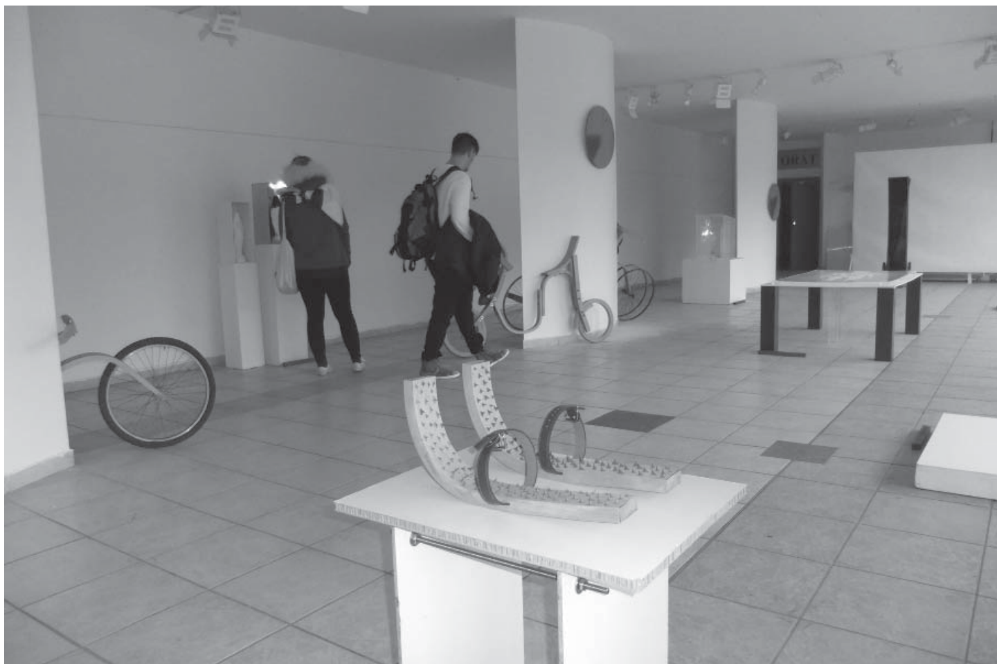
Partnerom celej akcie je spoločnosť z Bílovic, ktorá sa zaoberá vývojom a výrobou mestského mobiliáru a exteriérového nábytku, čo bolo na niektorých exponátoch výstavy úplne zjavné. Jeden z bicyklov z ohýbaného dreva je už dokonca vo vlastníctve majiteľa tejto firmy, fanúšika cyklistiky, a vraj aj ostatné sú už rezervované... Veď aj stoja za obdiv!