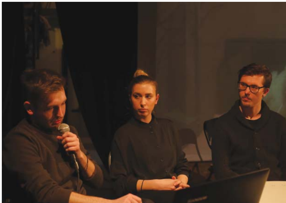
Študenti Katedry IDM počas prezentácie