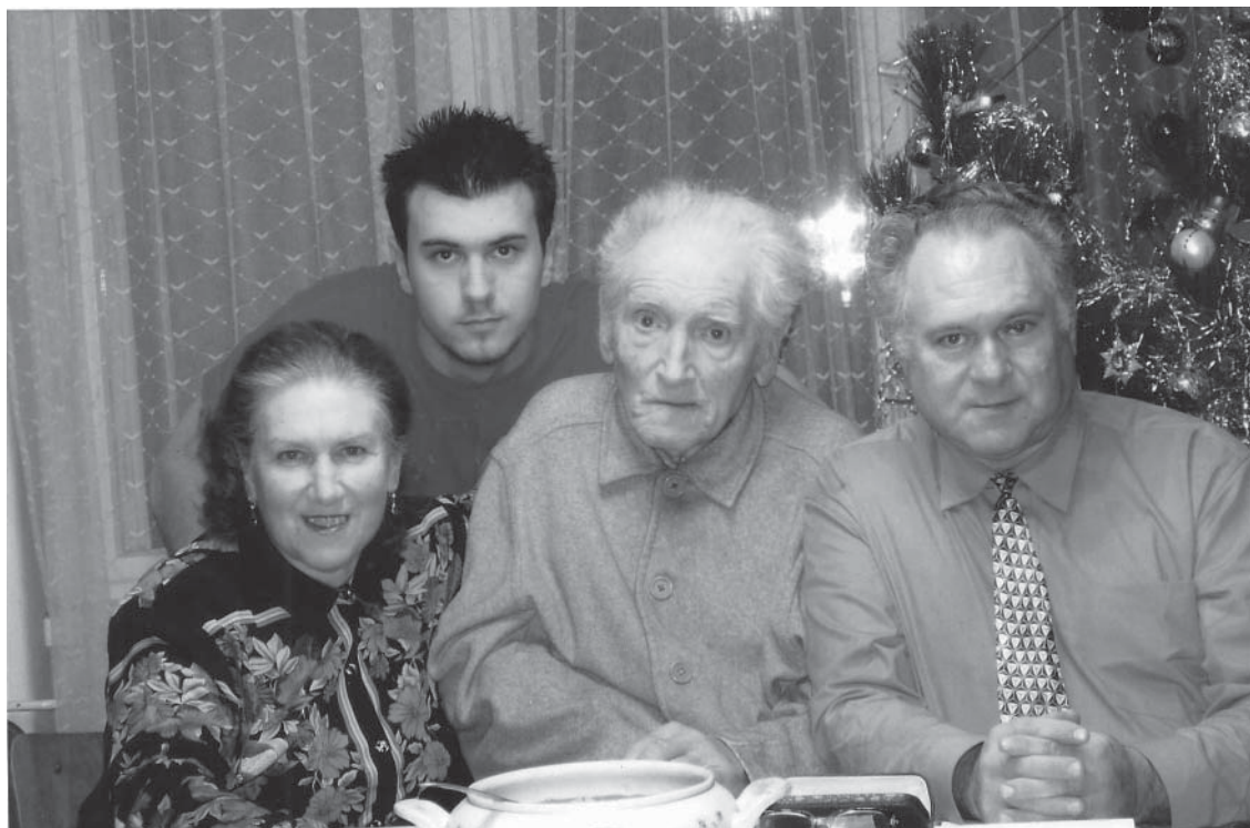
V rodinnom kruhu

10 hodín denne! Nie každý takúto záťaž vydrží a tí, čo nepreniknú do špičky, idú do orchestrov. No tým, že sa orchestre z finančných dôvod zatvárajú, je vstup do nich veľmi ťažký. To sledujem aj vo Viedni – príde 120 prihlášok na jedno miesto u filharmonikov, pozvú z nich maximálne 50, aj to zväčša absolventov tamojšej vysokej školy alebo prosto Rakúšanov, aby tak minimalizovali zastúpenie Aziatov a aby sa to nemiešalo. Lebo, keďže filharmónia každoročne absolvuje turné po Japonsku a hrá operu, tak domáci diváci si žiadajú Viedenčanov a nie Japoncov, ktorých môžu vidieť hocikedy. Nepodceňujem žiadneho lekára, ale ak lekár predpíše liek, ktorý nezaberie, nikto ho zato neodstaví, to by takých kiksov musel mať neúrekom. Keď však huslista príde na pódium a vypadne z pamäti, prestane hrať alebo zahrá falošne, každý to postrehne a už sa druhýkrát na to pódium nedostane. Je to jednoduchá rovnica: počujem - nepáči sa mi - ďalší.