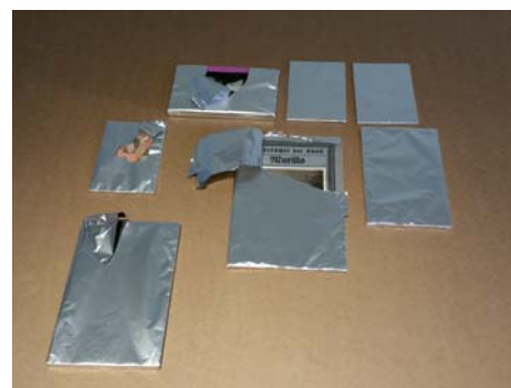
Pohľad na výstavu Kniha ako objekt