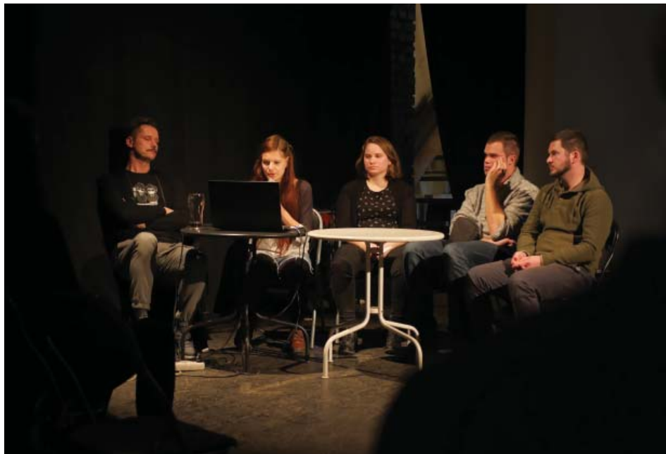
Študenti Katedry malby počas prezentácie