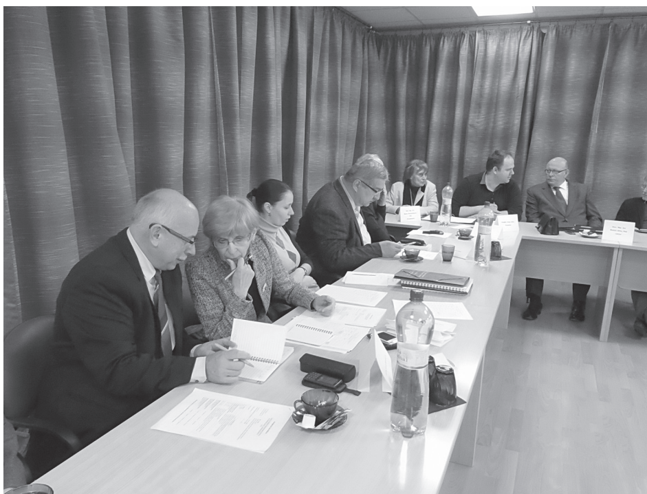
Fragment z návštevy akreditačnej komisie na našej pôde

V UPLYNULOM AKADEMICKOM ROKU PREŠLO PRVÝCH 22 SLOVENSKÝCH UNIVERZÍT A VYSOKÝCH ŠKÔL, VRÁTANE AKADÉMIE UMENÍ V BANSKEJ BYSTRICI, NÁROČNÝM PROCESOM KOMPLEXNEJ AKREDITÁCIE VŠETKÝCH SVOJICH ČINNOSTÍ – VZDELÁVACEJ, VÝSKUMNEJ, VÝVOJOVEJ A UMELECKEJ.