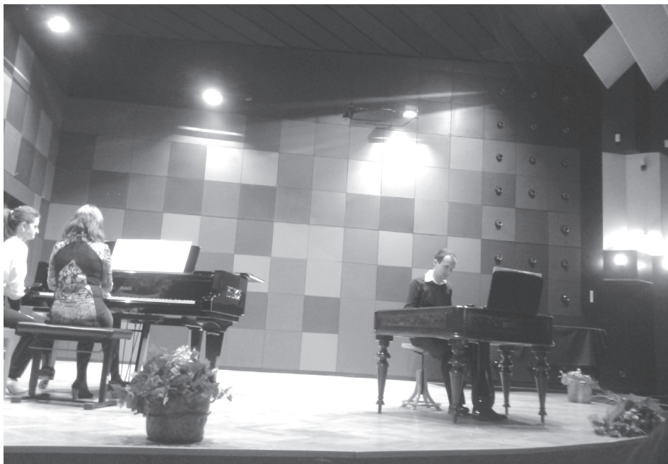
Fragment zo žilinského koncertu

CIMBALOVÉ ODDELENIE BANSKOBYSTRICKEJ AKADÉMIE UMENÍ ZORGANIZovalo AJ VĎAKA PODPORE TATRA BANKY ŠEŠŤ KONCERTOV V PIATICH SLOVENSKÝCH MESTÁCH POD VÝSTIŽNÝM NÁZVOM CIMBAL NAPRIEČ SLOVENSKOM. ZÁMĚROM TÝCHTO PODUJATÍ BOLO OBOZNÁMIŤ MLÁDEŽ, ALE AJ STARŠIE GENERÁCIE S HISTÓRIOU CIMBALU A HRÁČSKYMI MOŽNOSŤAMI, KTORÉ TENTO NÁSTROJ NEPOCHYBNE PONÚKA.