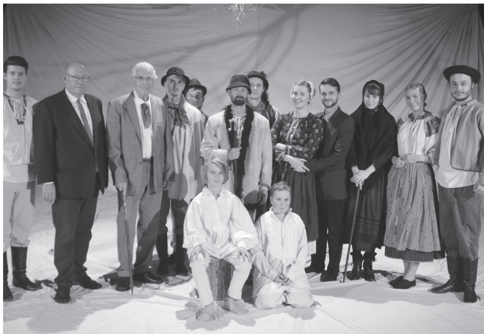
Aktéri hry Bačova žena