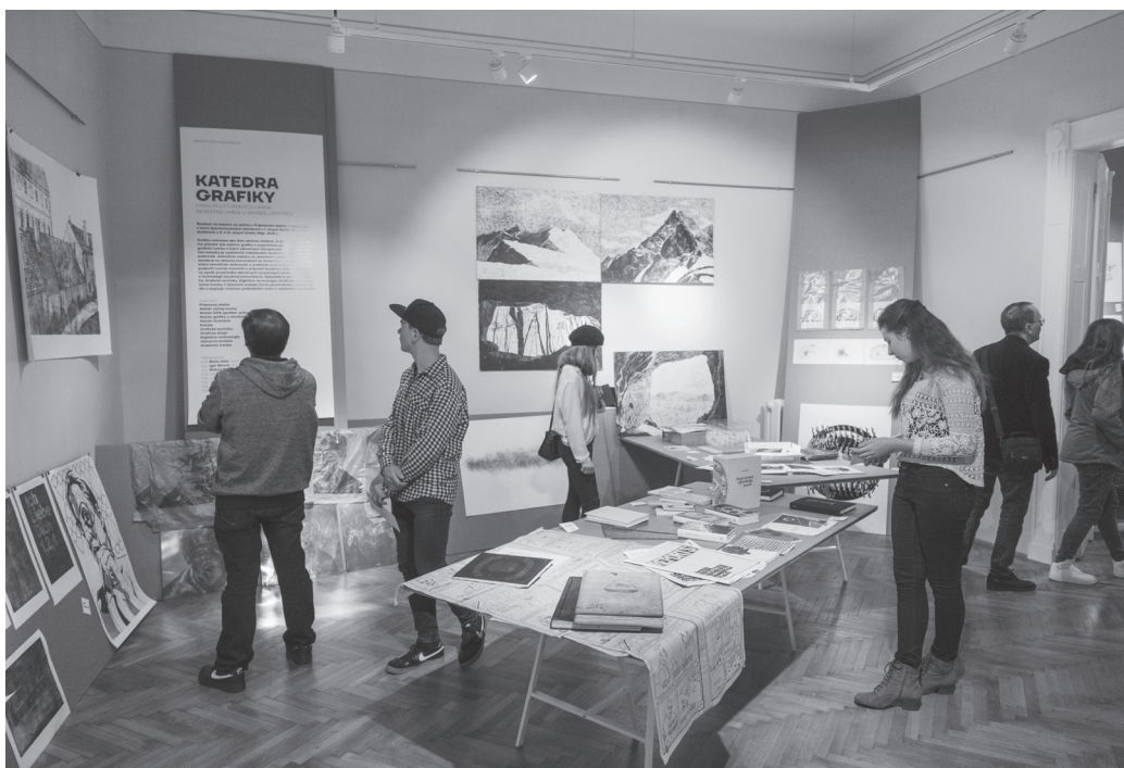
Pohľad na výstavu FAJN ART 1