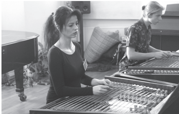
Dvojica aktérov v plnom nasadení