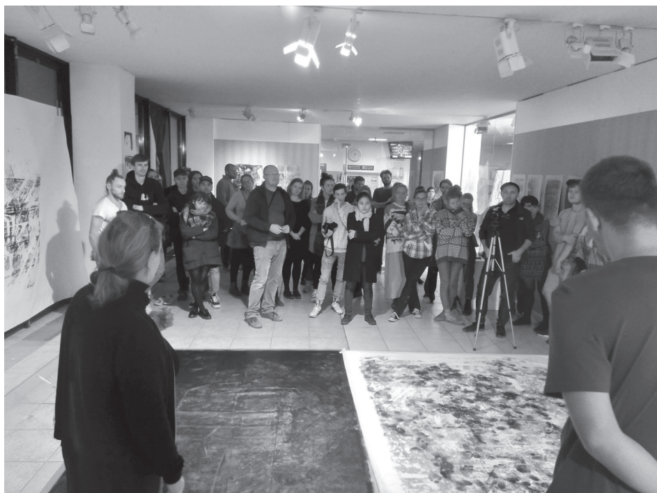
Záber z vernisáže v Galérii Fx