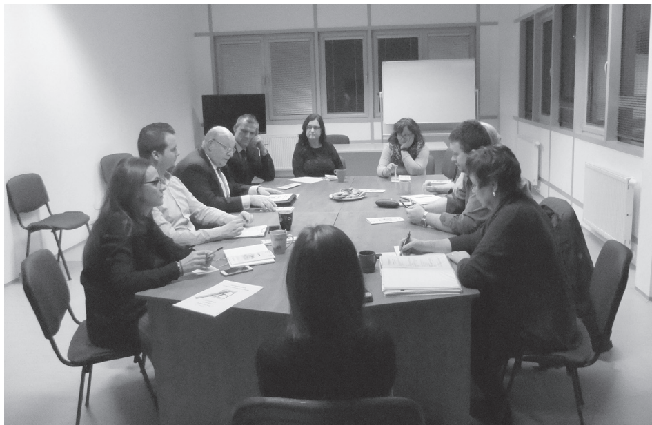
Zo zasadania občianskeho združenia pred premiérou

Moysesu a nie na FDU, s ňou akurát úzko spolupracujeme. Netajím, že táto spolupráca bude dôležitá z hľadiska naplňovania našich zámerov. Našou ambíciou je vytvoriť profesionálne činoherné divadlo v Banskej Bystrici. Takže časom, verím, sa osamostatníme. V Banskej Bystrici je množstvo veľmi šikovných absolventov našej fakulty, ktorí nedostali angažmán alebo stály angažmán v divadle, takže je tu personálna výbava na veľmi kvalitné profesionálne divadlo, ktoré chceme vytvoriť a dať týmto ľuďom priestor na tvorbu. Mám tiež ambíciu podporovať profesionálnu autorskú tvorbu.“