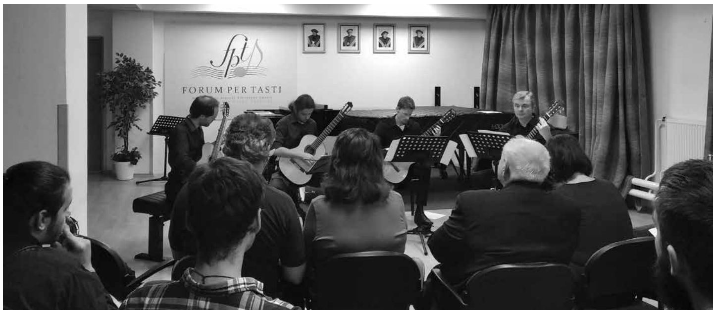
Gitarové kvarteto počas koncertu

Zámerom a ideou vzniku (2014) projektu Kompost bolo skvalitnenie vysokoškolského výučbového procesu a vytvorenie lepšieho dialógu vo vzťahu medzi skladateľom – interpretom – teoretikom umenia – publikom ako aj posilňovanie a zlepšovanie väzieb v hudobnej komunite.