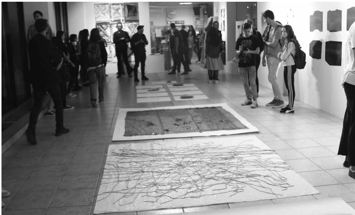
Z vernisáže výstavy

Medzinárodné podujatie Akčné polohy grafiky ako II. ročník česko-slovenského grafického workshopu vizuálneho umenia vytvára priestor a podmienky na zdokonalenie a napredovanie v oblasti súčasného umenia s dôrazom na alternatívne grafické techniky, experimentálne tendencie a akčné polohy grafiky absolventom a pedagógom vysokých umeleckých škôl na Slovensku, v Čechách a tento rok aj v Poľsku.