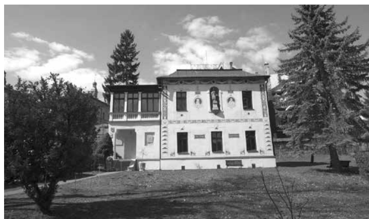
Vila D. Skuteckého

Stála expozícia Dominika Skuteckého otvorila SSG 22. 5. 2020. Zámerom novej expozície maliara Dominika Skuteckého je využiť potenciál umelcovej vily v Banskej Bystrici ako autentického prostredia jeho tvorby a rodinného života. Usadil sa tu koncom 19. storočia, po dlhoročnom pôsobení najmä v Benátkach a vo Viedni. Vilu si nechal postaviť podľa vlastných návrhov v neorenesančnom štýle so sgrafitovou výzdobou na priečelí, ktorú aj sám vytvoril.