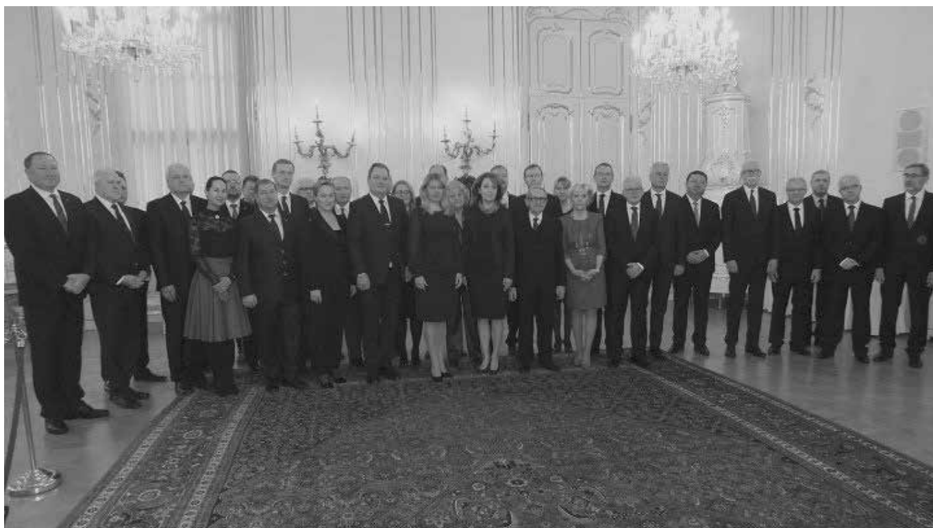
Prijatie rektorov vysokých škôl v Prezidentskom paláci v Bratislave

Prezidentka SR Zuzana Čaputová prijala v januára t. r. v Prezidentskom paláci v Bratislave členov Slovenskej rektorskej konferencie (SRK) a členov predsedníctva Slovenskej akadémie vied. Orgán reprezentácie vysokých škôl na slávnostnom prijatí zastupovalo široké spektrum rektoriek a rektorov slovenských vysokých škôl a univerzít, ktorí ocenili pozvanie do Prezidentského paláca.