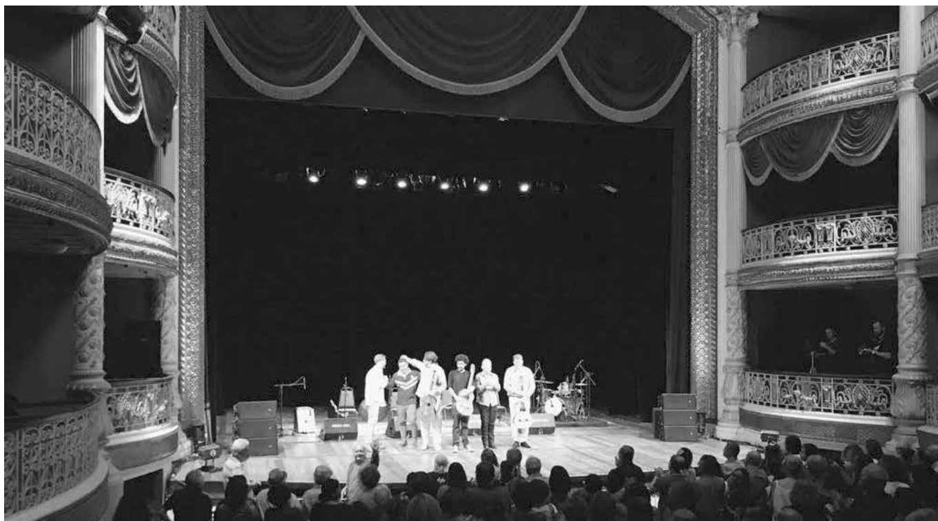
Spoločné vystúpenie našich a brazílskych umelcov