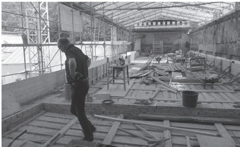
Strecha južného krídla. V uplynulých týždňoch sa tu robili armovacie práce, šalungy.